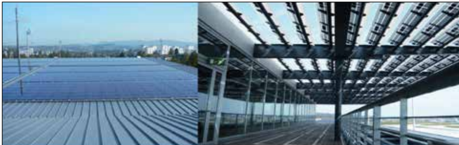
204.4 kWp Bossard Arena Zug